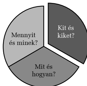
2. ábra. Az ifjúságsegítői képzés alapkérdései

A szakértők válaszaiból kitűnik, hogy jelen pillanatban csak korlátozottan érvényesül valamifajta egységes és egyértelmű kép az ifjúságsegítői képzésről. Túllépve az olyan ritkán, de azért előforduló kérdéseken, amelyek a képzés létjogosultságát firtatják, jellemzően a „megrendelői” (állami) inkompetenciát és az odafigyelés hiányát felemlítve alapvetően három alapvető kérdéssel találkoztunk.